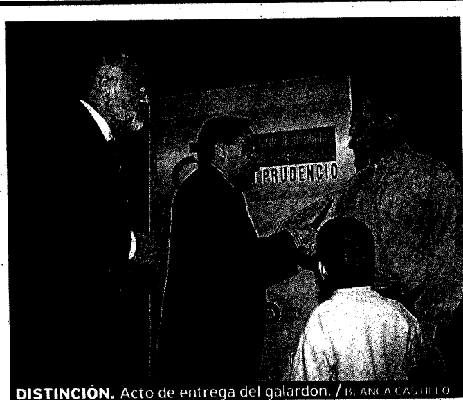
DISTINCIÓN. Acto de entrega del galardón.

to a otros grupos de las plantillas de Babcock y de La Naval. Los congregados trataron de dejar patente su protesta aprovechando la presencia en Vitoria del presidente del Gobierno, José Luis Rodríguez Zapatero.