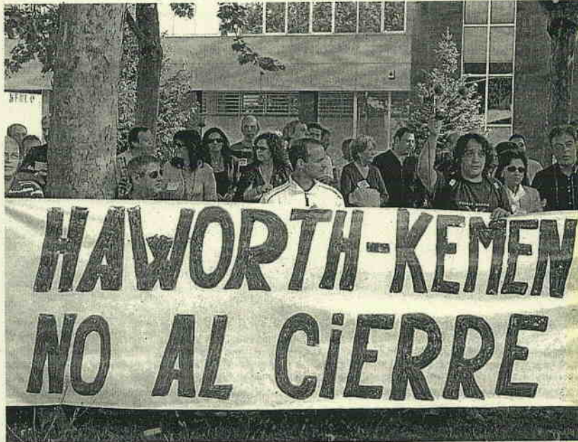
Las puertas de la histórica Kemen se cerraron definitivamente el pasado 31 de diciembre.

UN PROGRAMA DE SEIS MESES EN enero de 2011 el servicio de empleo